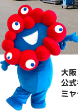
大阪・関西万博 公式キャラクター ミヤクミヤク