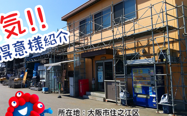
所在地：大阪市住之江区