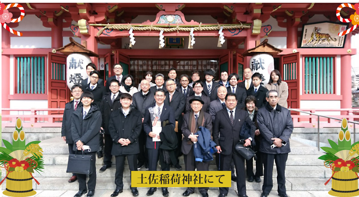
土佐稲荷神社にて

社長からの運営方針のお話では、会社の今後の話や考えを伺うことが出来て勉強になりました。表彰では上司の方々の功績が見え、私今後の目標になりました。 今回の祝賀式で得られたモチベーションを保ち、今年も仕事に励みます。