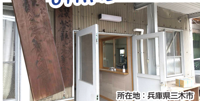
所在地：兵庫県三木市