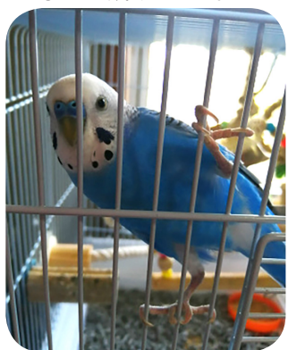
(二代目ピーちゃん)