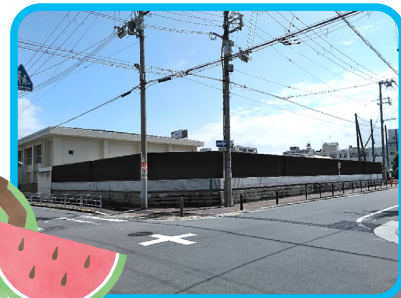
大阪市立T中学校外柵工事

弊社の新しい取り組みとして、現在8つの新事業に取り組んでおり、その一つとして材工共販の強化があります。従来は物販販売を中心にお客様へサービスを提供してまいりましたが、更なるサービス向上を目的とし、物販のみならず工事請負を強化しております。すでに実績のある金物工事、内装工事、外構工事を主力とし、新たに住宅設備機器工事や板金工事にも工種を広げ新築、改修に関わらずあらゆる現場で必要に応じた工事の提案と施工が可能になりました。近年は日本全国で震災や豪雨、台風など頻りに自然災害が発生しております。安全で安心な生活を守るためにも、ご自宅で修繕工事や災害対策工事をご検討されていまして是非、弊社へご相談くださいませ。