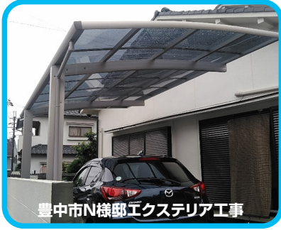
豊中市N様邸エクステリア工事