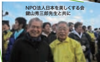
NPO法人日本を美しくする会 鍵山秀三郎先生と共に