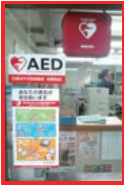
当社もAEDを設置しました

「自動体外式除細動器」といいます。AEDは、「突然心臓が止まって倒れてしまった人の心臓のリズムを心臓に電気ショックを与えることにより再び正しいリズムに戻し、蘇生するための治療機器です。AEDは、心停止により突然倒れた人すべてに対して、必ずしも有効ではありません。AEDが有効に働くのは心室細動による心停止に対してのみです。しかし、倒れている人が心室細動かどうかはAEDを装着してみないと分かりません。もしAEDが作動しない時にはAEDの指示に従って人工呼吸、心臓マッサージの心肺蘇生を続ける必要があります。近年、空港や駅、ホールなど不特定多数の人が出入りする場所にAEDが設置されることが多くなってきました。なぜなら、医師や救急救命士の到着を待ってから治療を始めたのでは、倒れた方の多くを救命できないからです。今後ますますAEDの設置場所が増えてくると考えられます。弊社でも、2010年2月13日より本社内にてAEDを設置しました。それと同時に「高度管理医療機器等の販売業賃貸業」の許可を大阪府より取得しました。日本では、心臓の発作により突然倒れてなくなる方が1年間に約3万人もいるといわれています。突然倒れた人に対してAEDを使うことにより、より多くの人たちが助かることを願います。