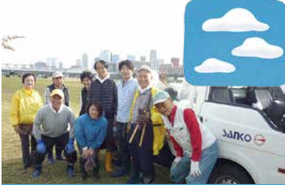
日時 2015年12月6日(日曜日) 場所 大阪福島区(淀川 海老江地区) 淀川大橋南詰 参加者 約40名

このような短い時間の中で、自然に恵まれているこの淀川をお掃除させて頂いている自分達の今の生活に感謝の一日でした。ありがとうございます。合掌。