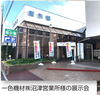
一色機材(株)沼津営業所様の展示会