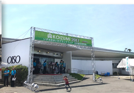
(株)小泉相模様の展示会