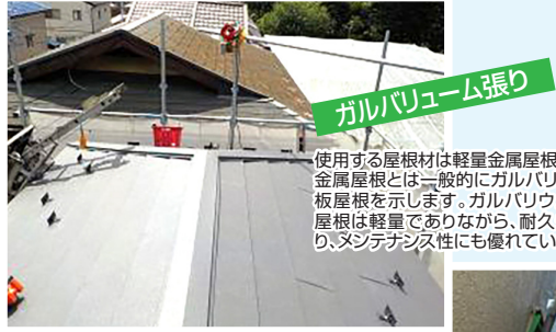
ガルバリウム張り

主な役割は防水です。最終的に雨漏りを防いでくれるのはルーフィングシートです。屋根瓦に隠れてしまう部材だからといって、低価格低品質の製品を使用しないでください。