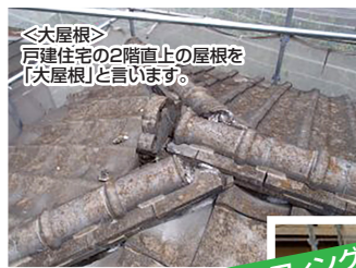
<大屋根> 戸建住宅の2階直上の屋根を「大屋根」と言います。

屋根は目立たず、目視で確認できないのでつい後回しになりがちです。しかし、屋根のメンテナンスは最も最優先すべき事項です。台風で棟板金が飛ばされる事故や、長雨時の雨漏りによる内部腐食、地震時には屋根の重さが影響して住宅が倒壊します。屋根改修は外壁の色あせや汚れよりもはるかに緊急性を要します。「谷樋」と呼ばれる屋根は屋根と屋根が凹んで取り合う部分に板金を敷いています。経験上、最も雨漏りが生じやすい部位です。つまり、屋根のリフォームスケジュールを基準に外壁工事を考えることが正しい考えです。