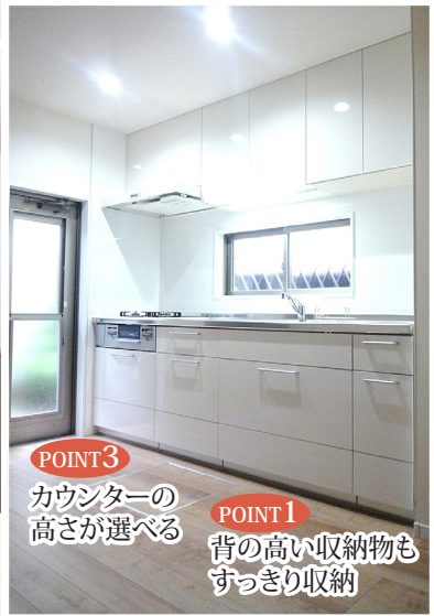
POINT3 カウンターの高さが選べる