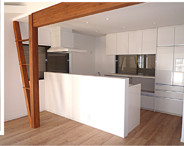
POINT2 汚れが落ちやすい調理機器