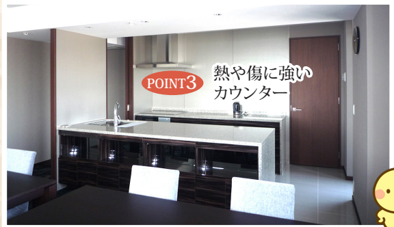
POINT3 熱や傷に強いカウンター