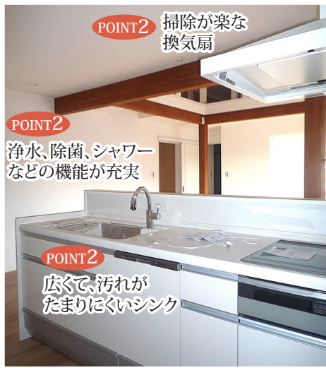
POINT2 掃除が楽な換気扇

動きやすく使いやすいこと。熱や傷に強いカウンターなら気を使わずに調理できる。明るく、寒暖差が少ないことも大切。