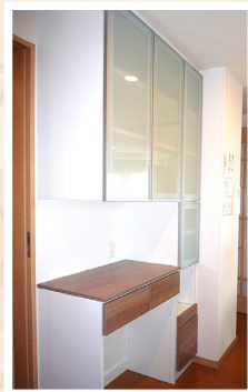
POINT1 たっぶり入る大型収納